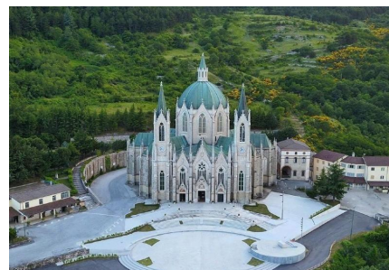
Castelpetroso: Basilica dell'Addolorata