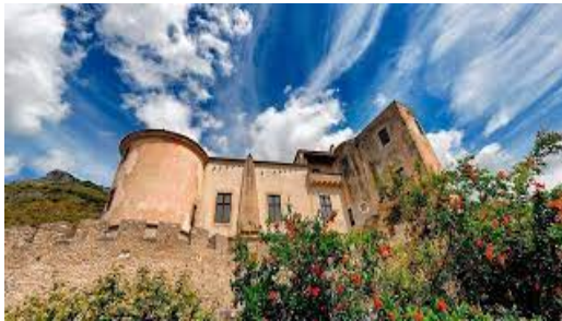
Vanafro: Castello di Pandone