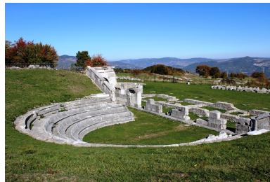
Santuario Sannita di Pietrabbondante