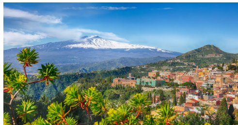
Taormina: Teatro Greco