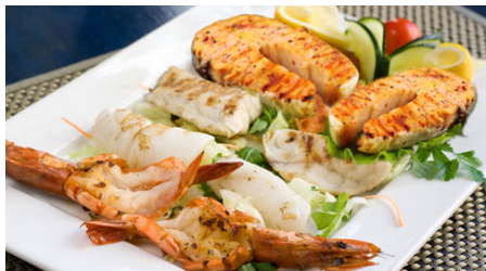
Sicilia: sapore di mare